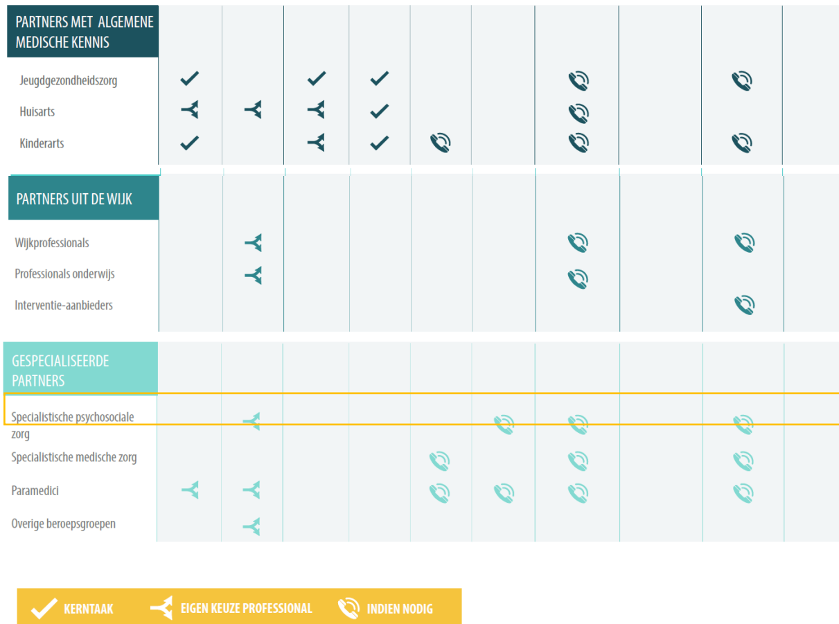
Figuur 2 Partner schema van het landelijk model 'Ketenaanpak voor kinderen met overgewicht en obesitas' (Care for Obesity, december 2018)

De rol van de huisarts kan bij iedere stap van belang zijn. Twee stappen sluiten echter bijzonder goed aan bij de primaire verantwoordelijkheden van de huisarts: het constateren van overgewicht (stap 1) en vaststellen wat er speelt (stap 2). In de overige stappen vervult de huisarts een aanvullende rol.