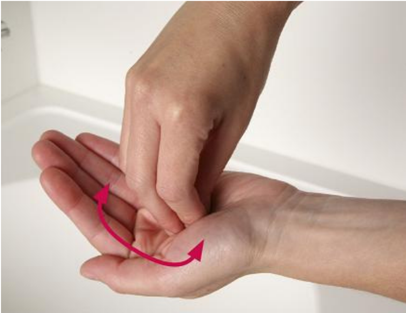
6. houd de vingers bij elkaar en draai de vingers in de palm van de andere handen en andersom