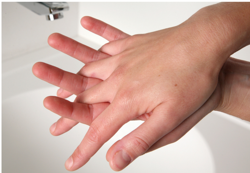
4. wrijf handpalmen tegen handpalm met gekruiste/gespreide vingers