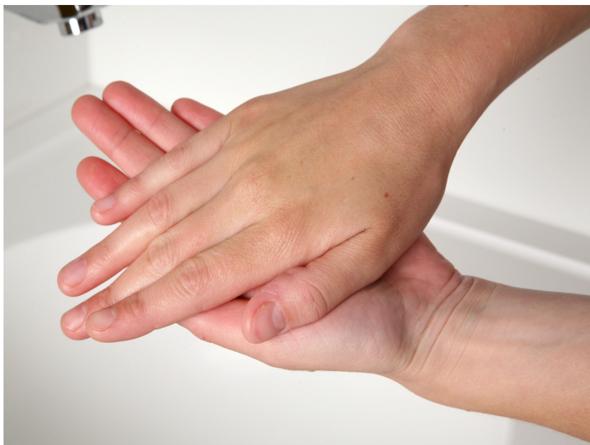
2. wrijf de handpalmen over elkaar