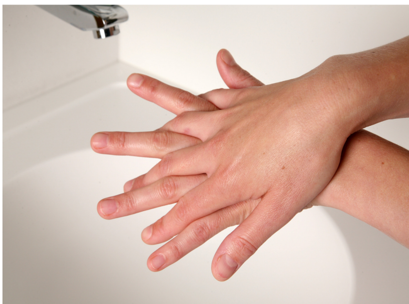
3. wrijf met gespreide vingers, de rechter handpalm over de linkerhandrug en andersom