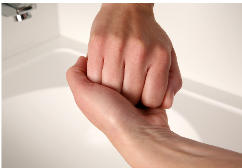
5. wrijf de buitenkant van de vingers over de tegenoverliggende handpalm met in elkaar grijpende vingers