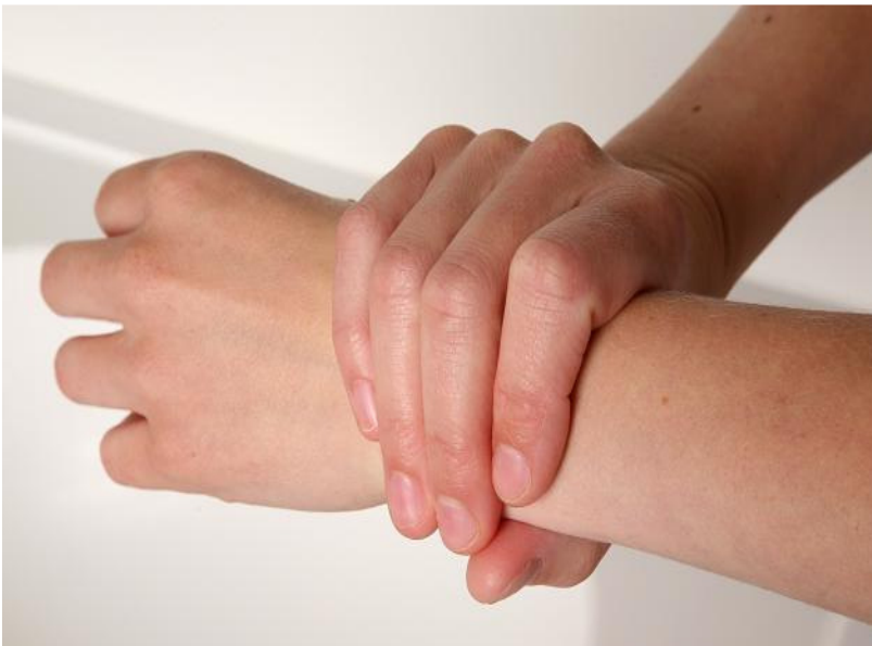
7. draai de palm van de ene hand rond de pols van de andere en andersom