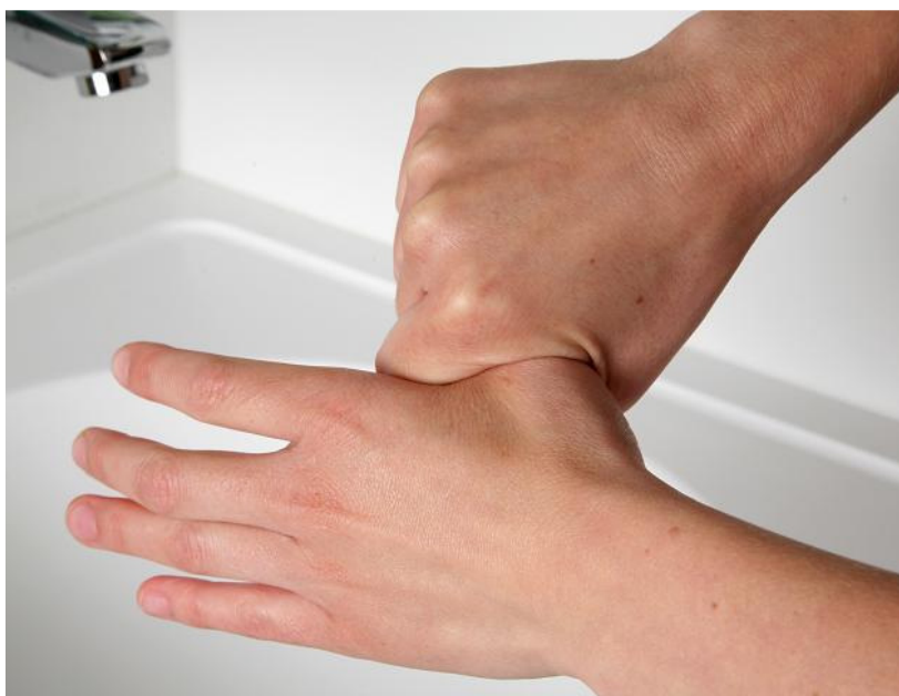
5.wrijf draaiend met de linker duim in de gesloten rechterhandpalm en andersom