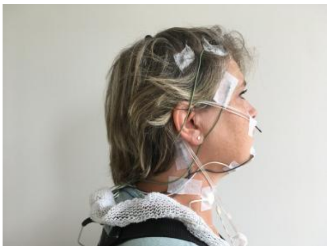
Foto: elektroden op het hoofd