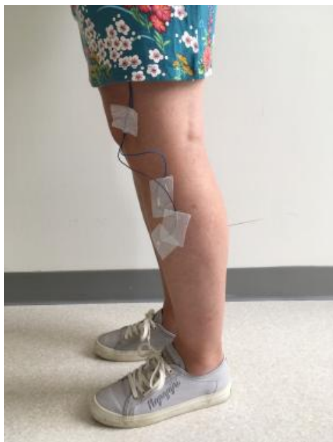
Foto: elektroden op de benen