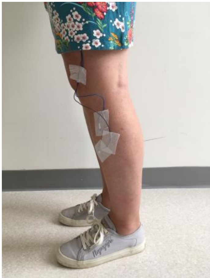
Foto: benen met elektroden