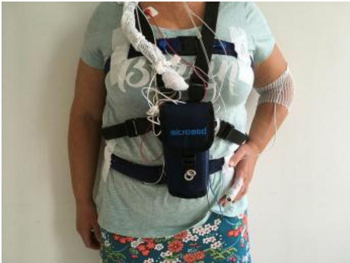
Foto: lichaam met elektroden