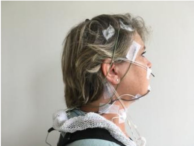
Foto: hoofd met elektroden