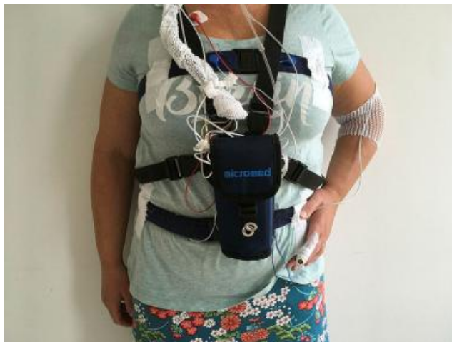
Foto: lichaam met elektroden