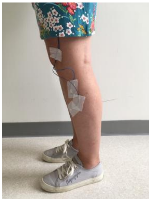
Foto: benen met elektroden