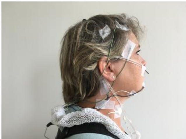
Foto: hoofd met elektroden