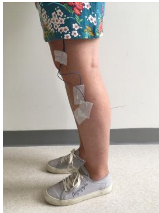
Foto: benen met elektroden