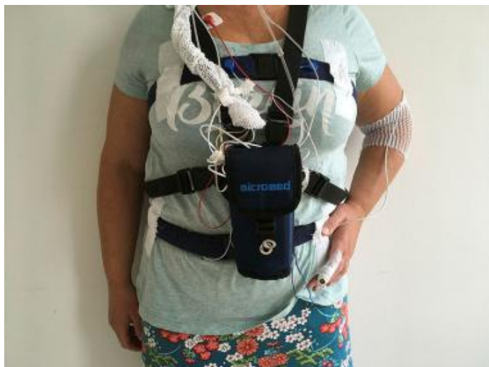
Foto: lichaam met elektroden