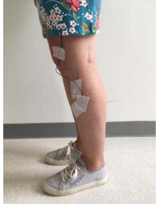
Foto: benen met elektroden