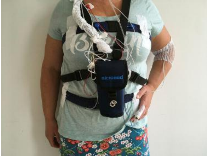
Foto: lichaam met elektroden