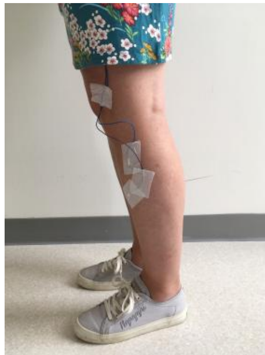
Foto: benen met elektroden