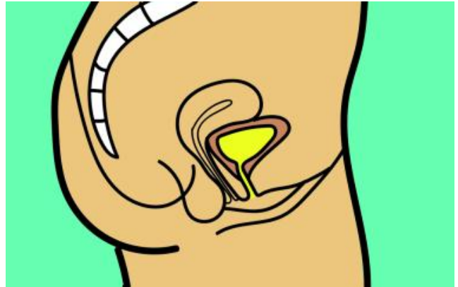
Dwarsdoorsnede blaas en urineweg bij de vrouw