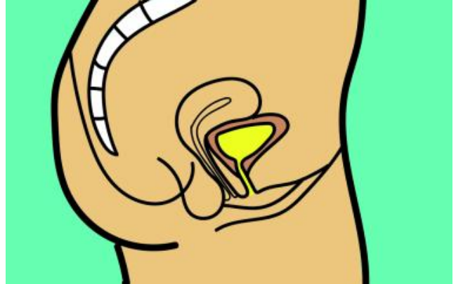
Dwarsdoorsnede blaas en urineweg bij de vrouw